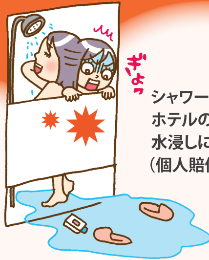
シャワーをあびていて ホテルの部屋を 水浸しにしてしまった (個人賠償責任)