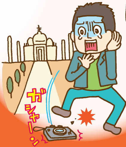
ガ ン カ ン